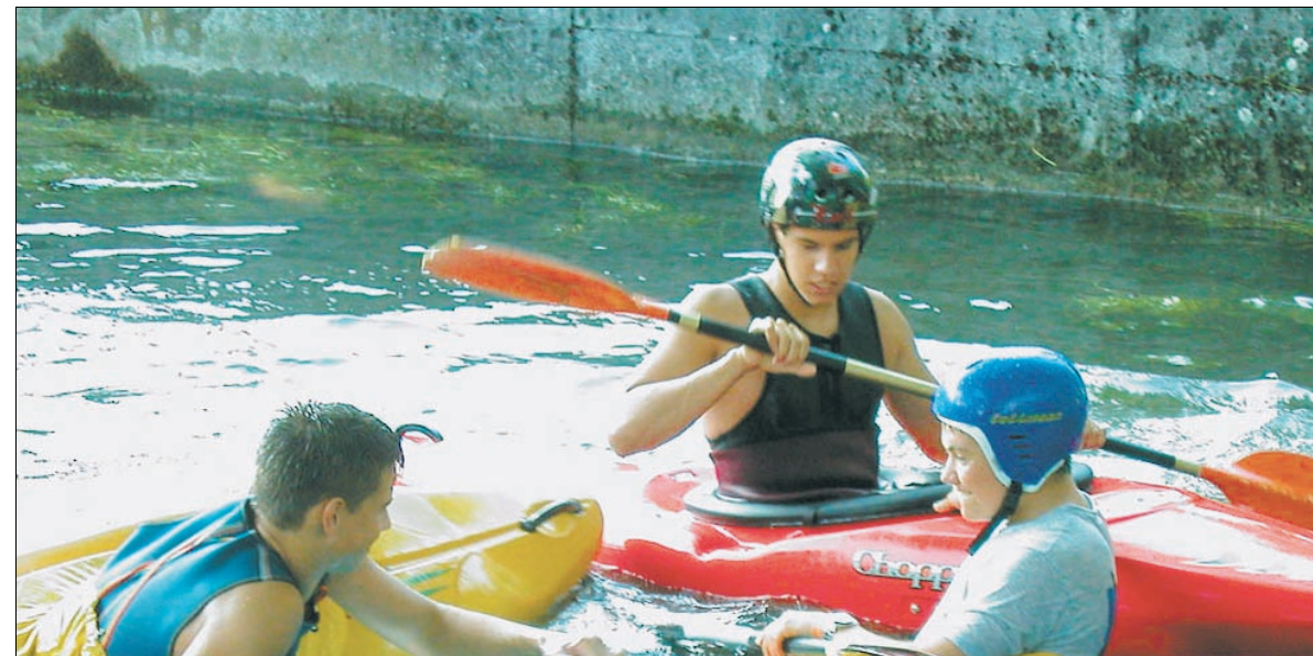
Ein bisschen Spaß muss sein: Kräfteressen unter den „jungen Wilden“ des Heidenheimer Faltbootclubs am Rande des Trainings.