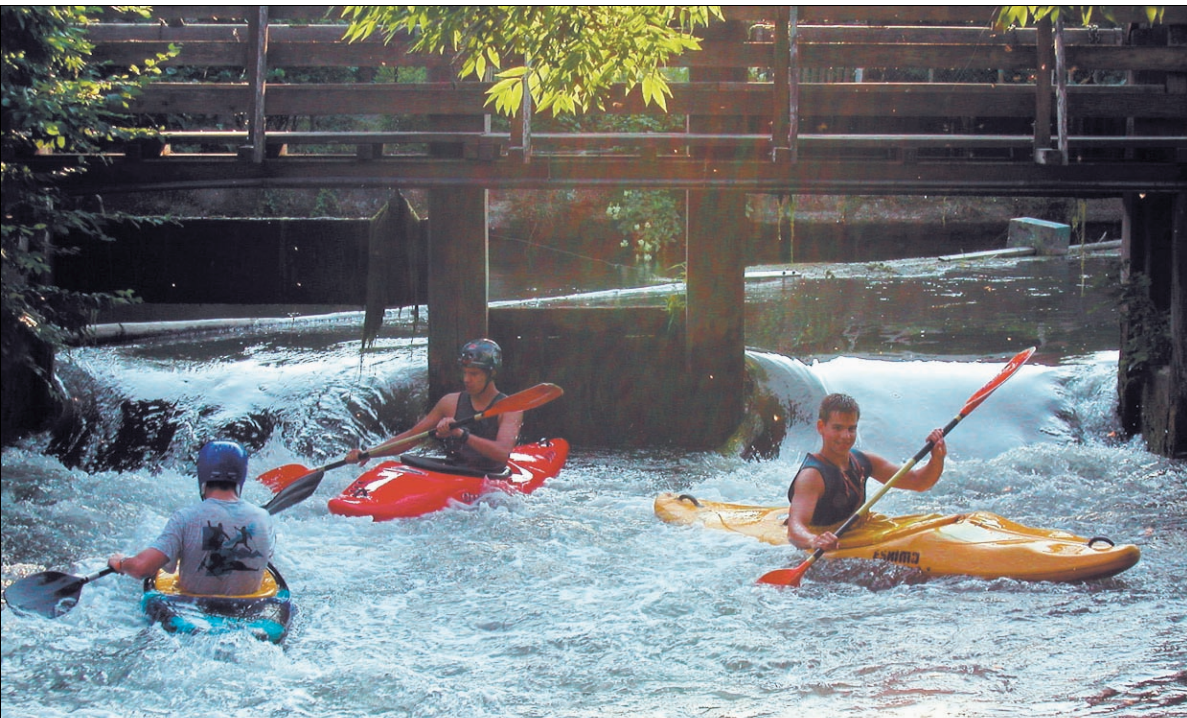
„Wilde Gewässer“ – auch das kann die Brenz sein. Von sechs Schwierigkeitsgraden erreicht der „Hausfluss“ des Faltbootclubs allerdings nur den ersten.