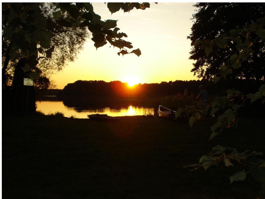
Sonnenuntergang am Glower See