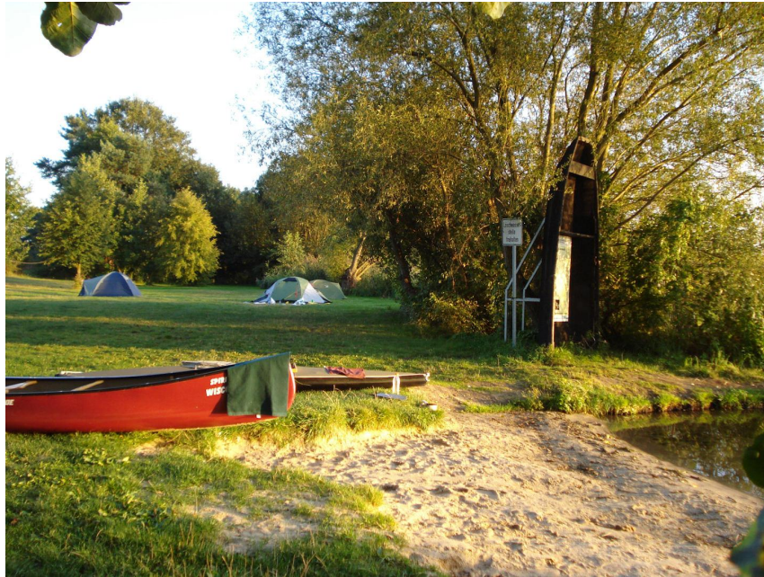
Bade und Zeltplatz am Glower See

Wir zelteten meistens auf den Campingplätzen der Wassersportvereine und wurden stets freundlich und kameradschaftlich aufgenommen. Da zu dieser Jahreszeit im September nur wenige Kanuten unterwegs waren, konnten wir die schönsten Plätze am Wasser aussuchen und vor den Zelten herrliche Sonnenuntergänge genießen, wie am Glower See oder auf der Halbinsel Raatsch am Neuendorfer See.